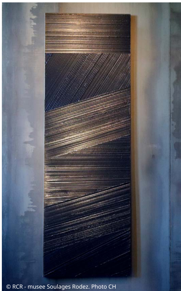
© RCR - musée Soulages Rodez. Photo CH